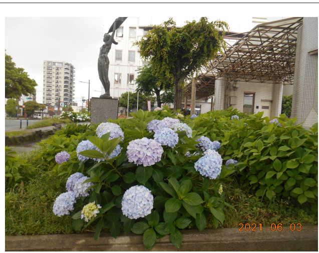
紫陽花の季節になりました。例年ですと「若松あじさい祭り」ですが、今年も中止だそうです。