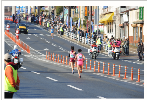
120 選抜女子駅伝北九州大会

■大黒柱 一家の大黒柱といふのは、家を養つて中心となつて支える人。指し示すが、もちろん語源は日本の伝統建築で骨組みの中心となる大黒柱。現在ではデザインや価格の問題から大 黒柱を立てる家は減つていますが、昔はこの大黒柱を基準として建物の直角と垂直が決められ、梁や棟、通し柱が組まれました。そしてなにより屋根の重さをがしり支える役目を果たしていたのです。 すべての柱や梁や棟が大黒柱を中心に絶妙なバランスで組み上げられ、力を受けあつていたからこそ木造家屋も地震に強かつたんですね。一家の大黒柱もそんな頼れる存在であつてほしいものです。