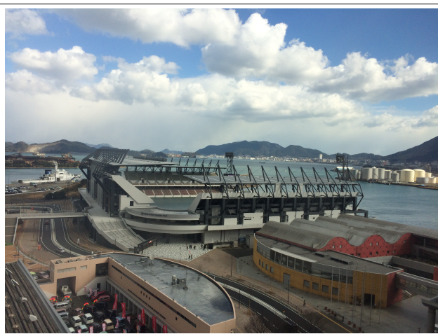
<ミクニワールドスタジアム北九州>