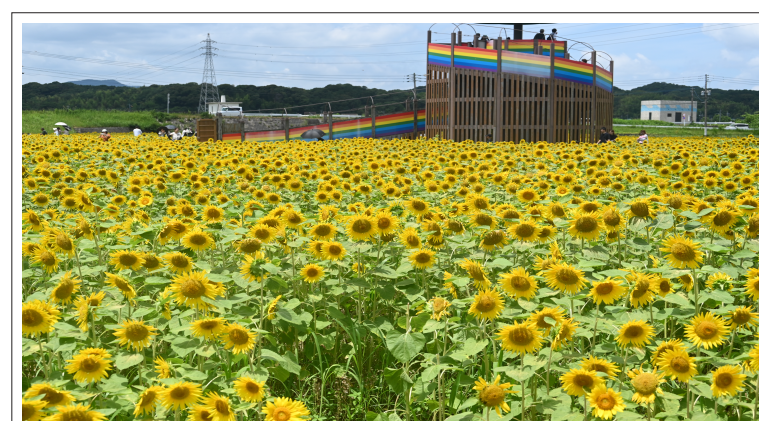
北九州市ではないのですが、大任町の道の駅に見事なヒマワリが咲いていました。（撮影日 7月6日）