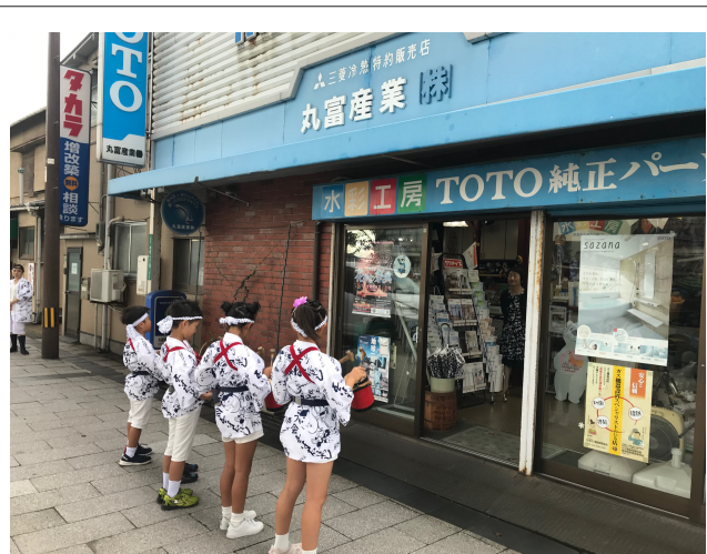
若松夏祭り「五平太ばやし」

りに間近で長時間使うのは体に良くないのでご注意ください。「冬に部屋の空気を循環させて暖房効率をあげる（夏は逆効果）」「ひとつのエアコンで別の部屋を冷やしたいときに風を送る」「部屋の換気」「部屋干しの洗濯物を早く乾かす」といった使い方が正解です。