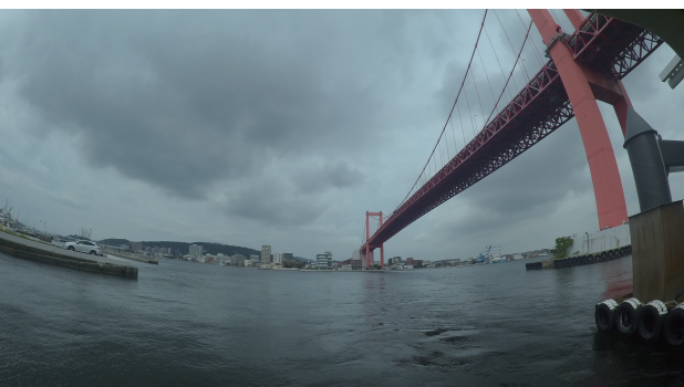
戸畑側から渡船に乗る

江戸時代中期を代表する京の陶工・尾形乾山。彼の興した乾山焼は、絵画的な意匠でうつわを飾る「琳派のやきもの」として日本の陶磁史に革命をもたらしました。乾山の系譜を彩る京焼のほか、やきものの美と応用する絵画もご紹介します。 期間：2025.1.10（金）～3.23（日） 会場：北九州市 / 出光美術館